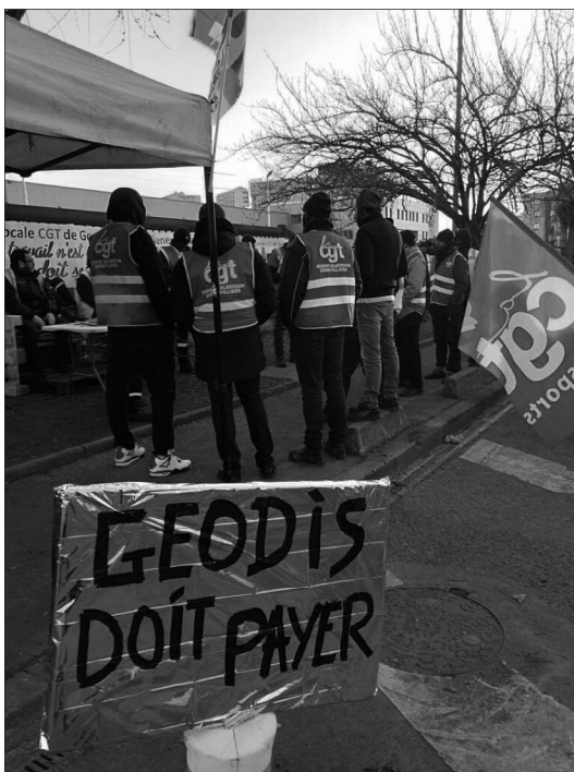
Soutien des Soulèvements de la terre aux grévistes de la logistique - Port de Gennevilliers, février 2025.

En construisant des revendications écologiques, en lien avec des revendications sociales, on peut mobiliser à la fois contre le productivisme destructeur, et contre l'exploitation de notre classe.